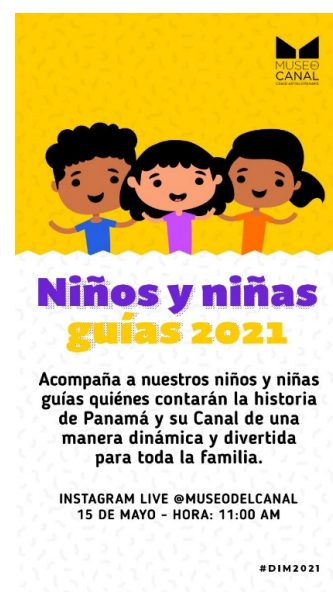
Affiches et photos des activités en mars dans le cadre de la célébration de la Journée Internationale des Musées 2021.

A partir du Musée du Canal, et accompagné par l'ICOM CECA, de nouvelles expériences récréatives et éducatives ont été réalisées ; interagissant avec le visiteur de manière virtuelle et face à face, comme par exemple :