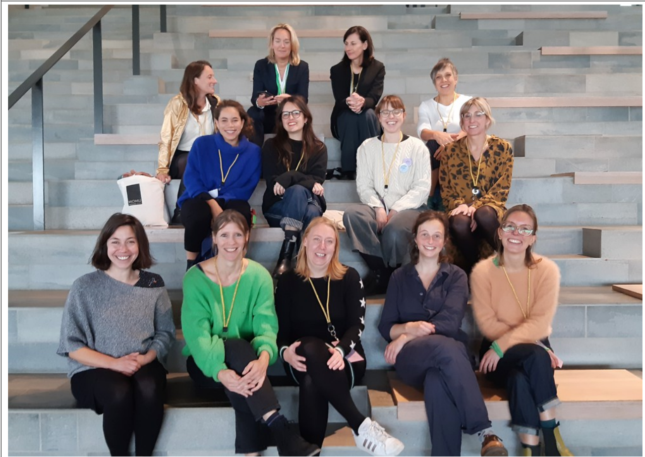
Asistencia de Bélgica a la Conferencia ICOM CECA Europa en el Museo Moesgaard