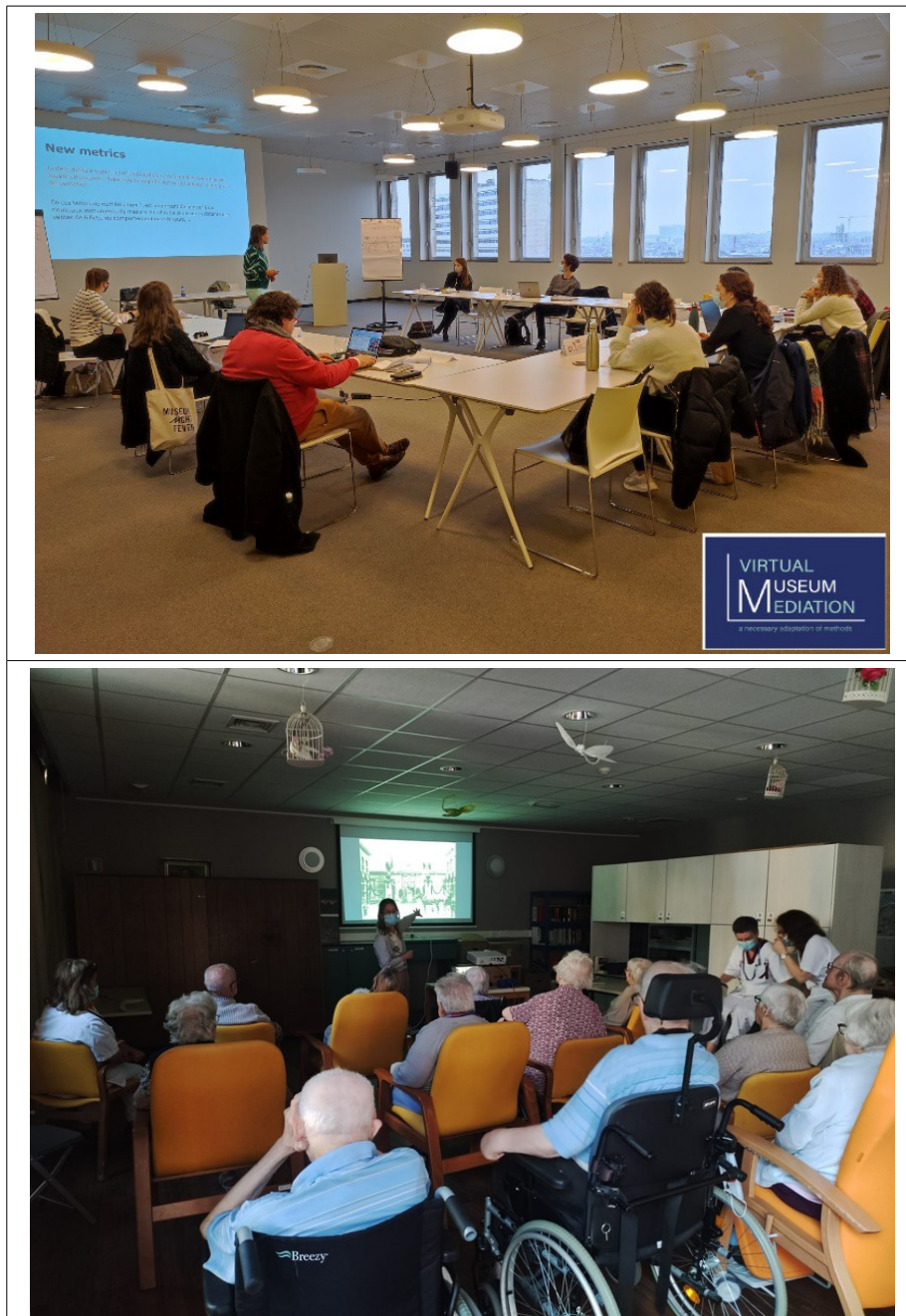
2 fotos: 3 y 4

Proyecto: Proyecto de solidaridad ICOM Bélgica - ICOM El Salvador, con el apoyo de ICOM Solidarit