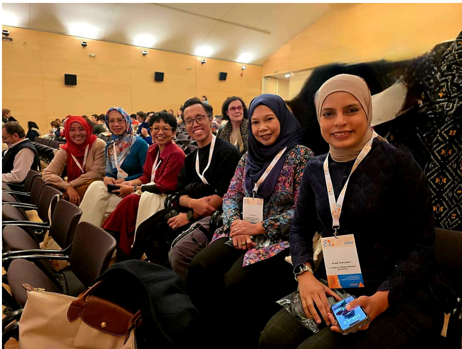
(Membres de l'ICOM-CECA d'Indonésie, de Malaisie et de Singapour lors de la cérémonie d'ouverture de la Conférence annuelle 2024 de l'ICOM-CECA à Athènes, Grèce)

Nous sommes heureux d'annoncer que davantage de membres de cette région ont participé à la conférence annuelle 2024 de l'ICOM CECA à Athènes, en Grèce, cette année. Les pays d'Asie-Pacifique représentés à la conférence étaient l'Australie, l'Indonésie, le Japon, la Malaisie, Singapour, la Corée du Sud et Taïwan.