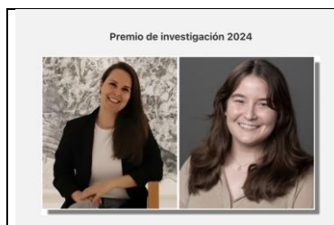
Premiadas CECA Colette Dufresne-Tassé 2024 (sitio web ICOM CECA diseño de Marie Françoise Delval)

La presentación de trabajos y la entrega de diplomas se realizó en Atenas el 20 de noviembre 2024.