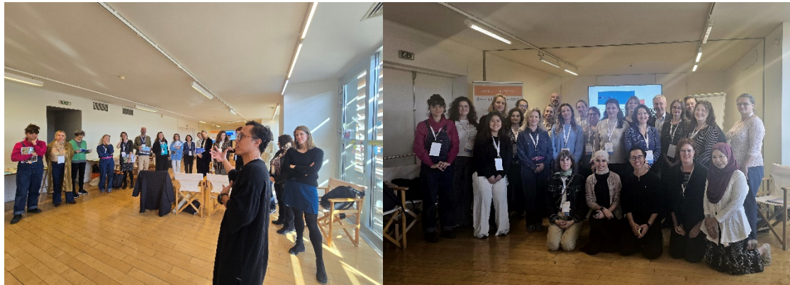
Arriba: Taller impartido por miembros del CECA de Singapur y Malasia sobre el uso de herramientas teatrales para tratar temas delicados o sensibles en los museos.