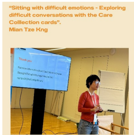
Arriba: Otro taller impartido por un miembro del CECA de Singapur sobre cómo sentarse ante emociones difíciles.

En general, 2024 ha sido un buen año para la región Asia-Pacífico, pero de cara al futuro espero ver una participación más activa de los miembros de esta región. También deseamos que la próxima conferencia anual se celebre en Asia en 2026.